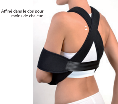
Affiné dans le dos pour moins de chaleur.