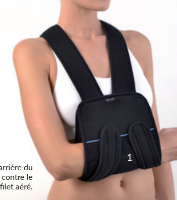
Paroi arrière du manchon, contre le buste, en filet aéré.