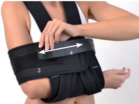
Existe en version universelle avec ajustement de la sangle humérale.